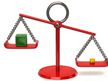
Systemisches Gesetz des Ausgleichs

Herkunftsfamilie und innere Familie, Schuldynamiken und Freiheitsbewegungen, Körpersprache, Erkrankungen und Aufstellungen von Symptomen, Organsprachen, Männer- und Frauenlinien, Hypothesenbildung sowie Lösungen und Strategieentwicklung.