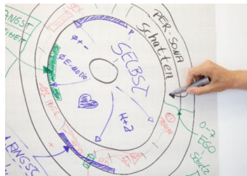
„Anatomie des EGO“

Live-Demonstrationen unterstützen das schnelle Verstehen der Methode und werden optional eingesetzt.